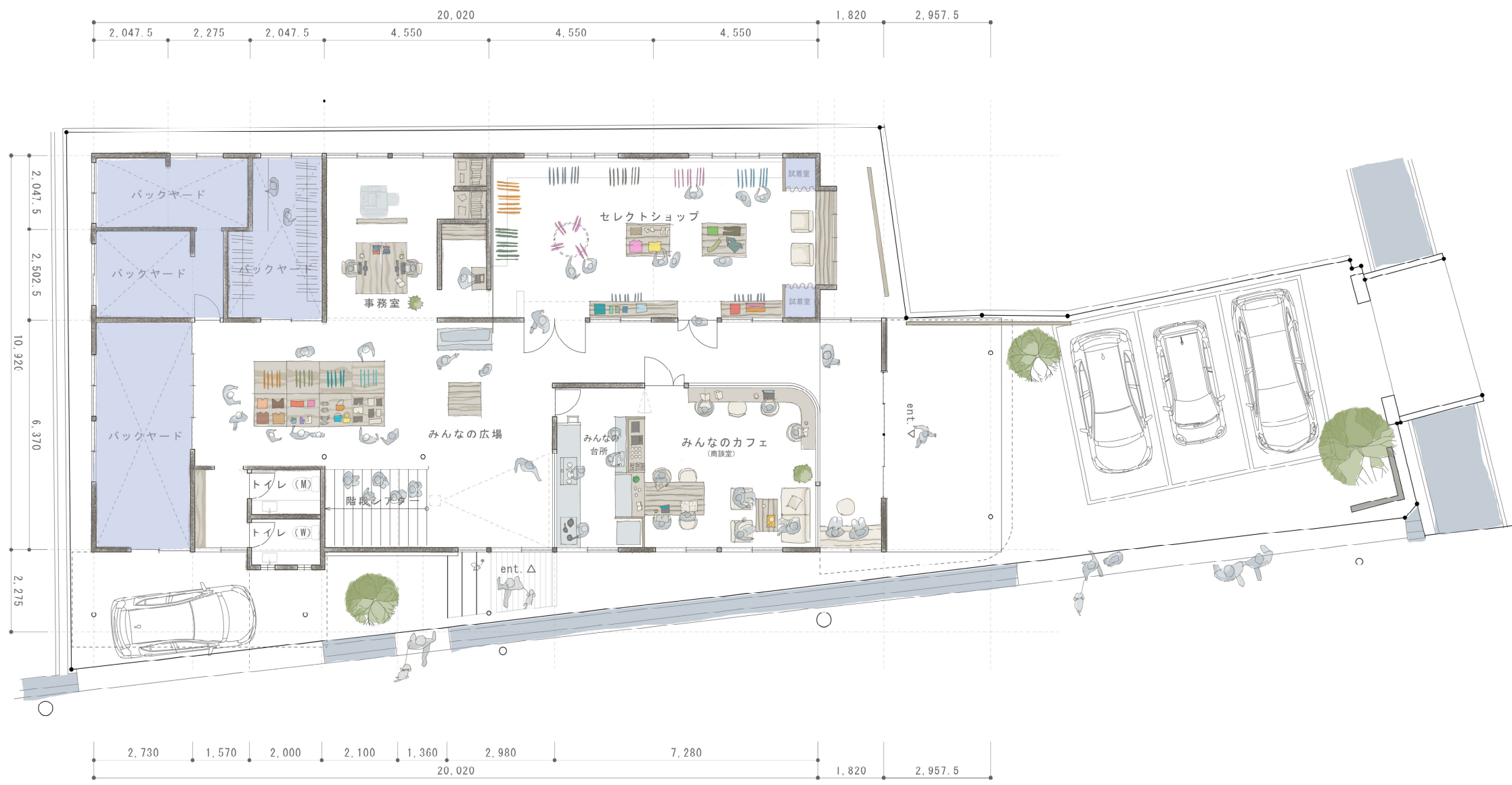
1F 平面図 1F : 230.21㎡ 2F : 218.61㎡ 合計 : 448.82㎡ (約135坪)