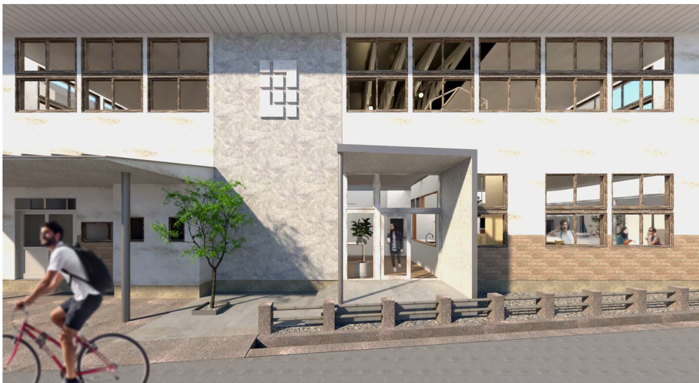
新設入口 東側一方通行側