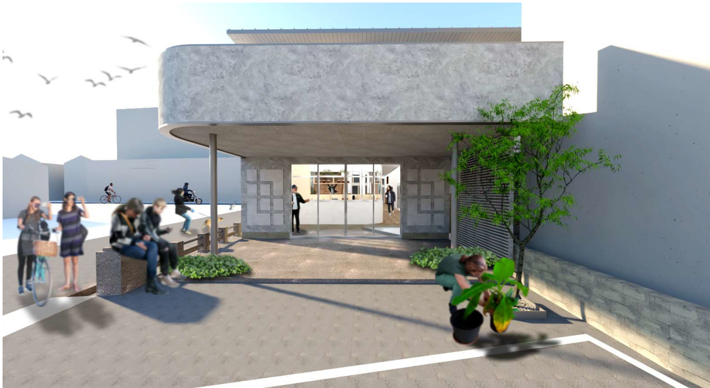
メイン入口 北側大通側